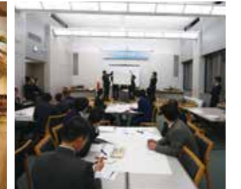
勉強会・セミナー