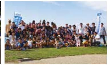
篠山JCとの家族交流会