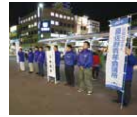
震災等の災害時募金活動

各種交流、震災等の災害時募金活動、災害支援等JCネットワークを活かした活動をしています。